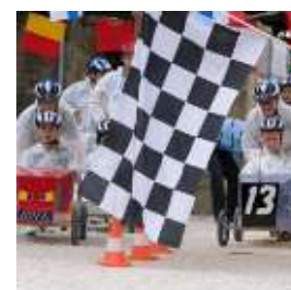
Seifenkiste-Formel 1 und Boxenstopp