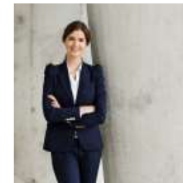
Fotoshooting - Business- und Gruppenfotos